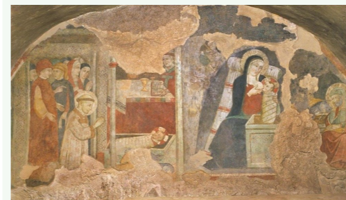
Natività di Betlemme e Presepe di Greccio (XV secolo) Maestro di Narni. Chiesa di S. Luca, Greccio.

C'è stato un tempo in cui Dio, il Figlio di Dio si è fatto bambino, con la semplicità del bambino. Dio ci parla anche come bambino, il linguaggio che usa per ciascuno di noi quando ci viene incontro, è la cosa più bella perché ci raggiunge in quel momento della vita in cui abbiamo più profondamente bisogno di lui. Nel Natale ci troviamo di fronte a questa meraviglia: Dio viene a gioire con noi, a soffrire con noi. Questo è il Dio che si rivela nel Natale, un Dio-Amore. Per questo, raccogliendo i sentimenti e i pensieri più belli e assicurando la mia preghiera per voi, davanti al presepe, di cuore vi dico: Buon Natale!